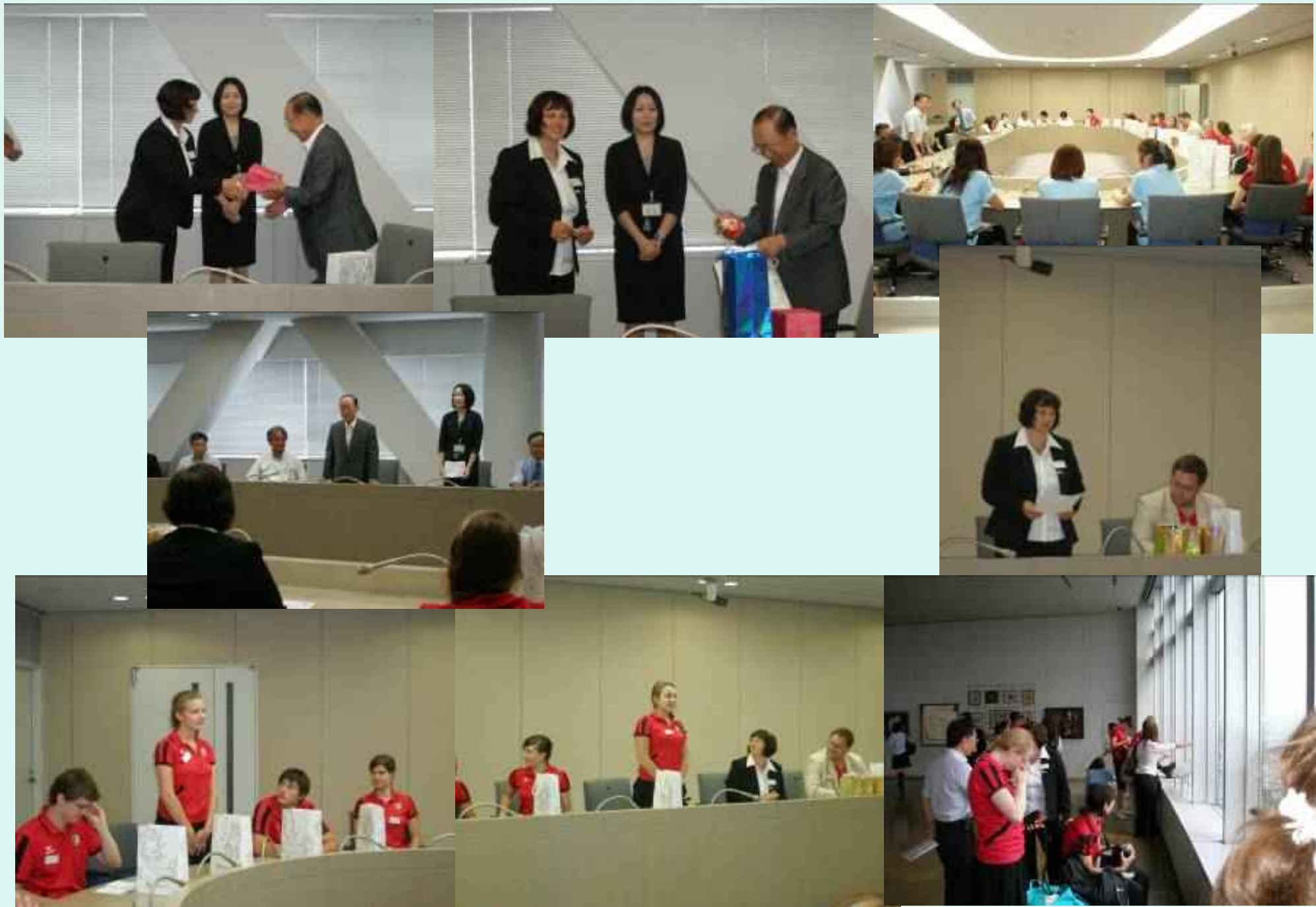
市役所の展望台から高崎市を眺めてから市長へ表敬訪問 緊張したかな？